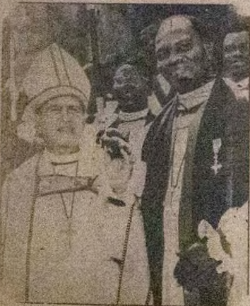
Eniti a wo ninu asu funfun ti o wo Argbada greje ni Olori awon Alufa lakiri ile Iwo Orin Afrika, Eni owo falo C. J. Patterson, on ti eniti o fi Ogbeni Alufa Bishop Iwe han gbogbo Ijo nigbati won ti je oye Diocese titun fun agbegbe ile Eimo Warri ati Asaba.