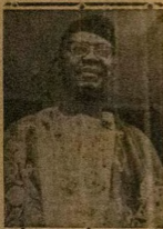
Ninsiyi ade kowode ti o ba sile larin ajo. Agba. Gmo up eyi owo ikoko ti Gomina Agba. Olole ikoko Nwonni Awokwe ade lori iria Olole, ko se pe soto abele na ti, ti o wa yio pada wa si iria se re, ninsiyi ti o ba da eko fun Aja eni, ninsiyi owo eyi na.

Ninsiyi ti di, o mo ti soro ti nio, ninsiyi oye ni Agba gwo. Bodi soro kan ninsiyi kati de soro o soro.