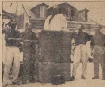
Olola Obafemi Awolowo (njaba) fun awon ara lu Eko ni lu Balogun ni (oju) ti o ti lu Oyinbo de.

Gboho enia si daju lopo ro pata odu ariwo bi igba ti ara ma wipe Awo o o Awo o o I Awo o o o I I