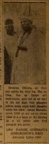
Ibadan Otuwa ni fun emi Odu ba dun ba. Ita se Oba. Iba se Iyoye ati zekunmu, ayo mi si ni lati ti le mi han tun gbojoo awon enia nipa kiki gbojoo nyan ku awa odun Kerestime 1956 yi ati odun titun 1966 ti o ba on yi. Ki Oluwa se e ni odun abo fun gbojoo wa amin