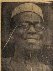
OLOYE OBAFERMI AWOLOWO Olol Egb Afenifere