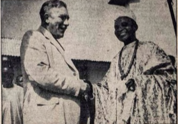
Olopa Oba Alaiyelawa, Ladapo Ademola Keji Alaka Abokuta fi tayotayo gbigbe Olofa James Robertson, Gomina -Agba Apapa Ijoba Naijiria lori ni Afiri re nigbati Gomina - Agba na npe ibowo awon Bu Ipinle Iwo -Orun