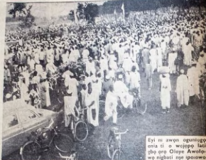
Eyi ni awon ogunlogu enia ti o wajopo lati gbo oro Oloye Awolowo nigbati nse ipawowo idibo ni Kano