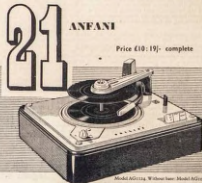
Price £10:19/- complete

“Qwariyan” kan otiri fun ile re! Adayawo eru PHILIPS titun ti o nparo rekodu bi lo eyigbi iro titun nimo Bido re... O si mo se fagadaga dada ni Abajo ti o fi ni anfani bi oya mokoalagun—bani, oya mokoalagun ni! awon anfani ti o ni mo wa. Itanin ti o wa ti o le beru, ti ko le ri ero ti o ni nipa igbafun titun ti o ni egbogbo anfani pupo to gbagbo owo re ti kere to.