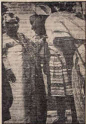
Iyawo Oloye Awolọwọ ẹgba iwe idibo tirẹ