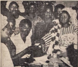
Iya Oloye Awolọwọ usure fun un