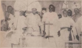
Apostle Adejumo bi o ti nge skata lati fi si ju ogoji saaw osan ati oron

A BERE PELU ORUKO OBA AJO-KE AIYE, OBA ASAKE QUN