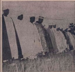
AWORAN yi ni ti awon Musulumi ti o lo jaba ni Oshade nima Qdan Iyeta ti o keja yi.

LATI igbati Ijeba Apapo Ijeba Najirra bere oran iwadi ile-ife-pampe ni National Bank ti o si ti di ti Ijeba Ipinle Two-Orun nialayit ti bere ni opolopo awon eni'isi pataki-pataki kakiri awon ile Ipinle Two-Orun ti bere si gha. owo won kuro nima awon banki ndan tabi ti awon Ogbeni onlowo ti won si nko won wa si 'National Bank' bend awon igbimo Ijeba. Iwadi awon Iju Ipinle Two-Orun paapa ti bere si ko won won wa si 'National Bank'. Awon (Wo oju owo keja).