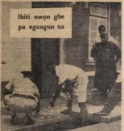
Ibiti nwon gbe pa egungun na

Awon jandakia atokun egungun keji na si gbin "Egunṣin Bam-gboṣe" labe to be go to si ku ipeseke. Awon oṣo pa ti ti awon etokun meji meji nitan etokun yi, niwon si ti beṣeṣe se wadi oṣo re lode egungun awon etokun. Bi awon ba si ti pari oran na si, 2 o ma a gbo o.