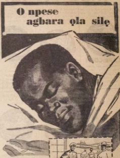
Orun asawara ti ko ba mo iyamu dari mo gboho agbara...