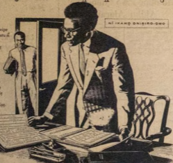
NI KAWO ONIŞIRO-OMO

OŞIRIKO aşıre lo ekan wije ipe-ehin ati ti ebi ila yi yio gheru ti l'opolopo l'ipe ipe. Şugbon ila yi nima awon to ti kika j'ole mga ipe won ki ghoşho ipe, ti ad ila di de. Ni awon onleşo-onya ni onirara ila ipe to je mo oja tina ati ria wa, a si otal fun awon onleşo na ni imoran to je to won onya. Awon U.A.C. l'aya lati yanşan wije awon nran ila yi kawa şipe kika paşpa nima awon egi yanşan şingila yi ni ipe.