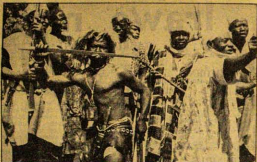
Aworan yi ni ti Pidanpidan ti o fe re ara re l'ahon nigbati nwon nse eye fun Macmillan ni Afin Oba Zaria

Odaran na so fun Adajo pe on jebi esun na ti awon olopa ka si on loran, s'igbon lati nigbati awon oje ti ji on ni owo ti on ti sifi oje olopa meji na da-awo bo ara on.