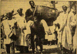
Aworan yi ni ti eniti o fi ara re se esin ti nwon si gun un fun eye Macmillan ni Afin Oba Zaria