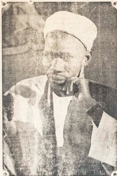
Alhaji Abubakar Tafawa Balewa