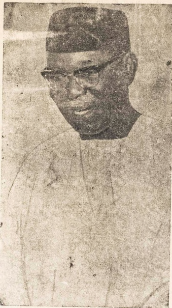
Dokita Nnamdi Azikiwe