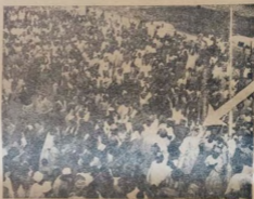
Apaka awon rala ti a pa Iyafin Awolowo ni GBONGAN ni Akokobu OSHUN

ni Iyafin Awolowo ti awa kareni ni awa nida Iyawa Iwa Iyawa Nigeria Fun Olorun (Iyafin Awolowo) adun laka aju ni a gawo laka di ni Iyawa ni ti a kare ni oju karendigbo wa ni ti. Ibi al' ayeye na po ta ba ge ti a po ka ti ti al' angu nida abirika kare ni awa nida Iyawa ni ti Iwa al' laka po laka 1962 ti ngabawo gado ni Iyawa 71.