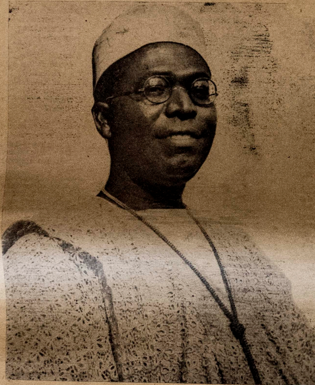
OLOYE OBAFEMI AWOLOWO