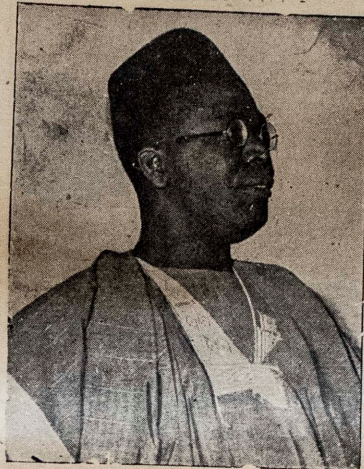
OLOYE OBAFEMI AWOLOWO

Ohun ti mo ni lati so fun gbogbo awon omo Oduduwa ti ilu Oyo ko po, sugbon mo fe ki awon ranti oloro won. Tabi enyin omo ibile Oyo