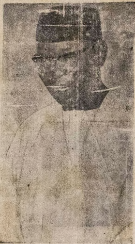
Olola Nnamdi Azikiwe OLORI APAPO IJOKA NADIIIA

O tun so wape ijoba on yio se agbara ati le ko oyo