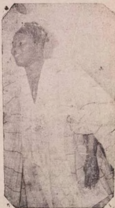
Oloye S. L. Akintola

Application Forms which must be completed in duplicate are obtainable from the Chief Personnel Officer, Electricity Corporation of Nigeria, Headquarters, 24/25 Marina, Lagos and they must be returned to him not later than the 9th of November, 1964.