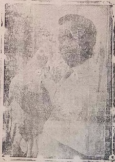
Aworan oke yi ni ti Okunrin kan ti o nko ise Adije titeju ninu Ogbi ikose Ogun osun.