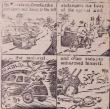
The careless Omolanke does not keep to the left