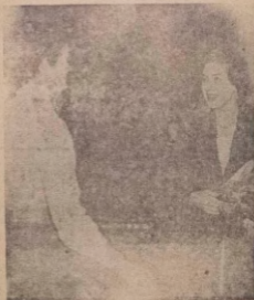
To... Margaret nighu... dudu ni owo on ti Okidun meja Young, on ni gbo alajo ti o fi koto eweko yi gungu na si, ti nba jara.