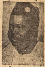
DR. OKPARA Olori egbe N. C. N. C.

Awon omo egbe Alakuko ti se eto ijiyan awon igbimo kan ti yio se eto lori asaro gegbebi awon omo egbe na yio se lasiko idibo si ile igbimo asafin ti apapo Ijoba ile Naijiria eyiti idibo re ni lati waye larin