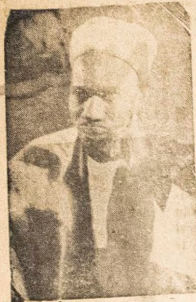
Alhaji Abubakar Tafawa Balewa

Loni mo fe ba gboabo orile ede wa soro die ninu oro Olurun nipa igba ati akoko ti a ni ati bi awa si ti nlo awon aniani ti awa ni. Lchin na kuni awa mu jace ninu awon aniani wa ninu akoko wa