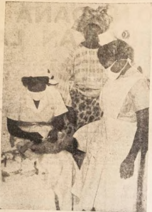
Aworan oke iwe yi ti e nwon ni ti awon onise ile ise Imototo Domisile nigbati awon lo wo obinin kan larin ti obinin na ti bimpo tan niu ile re ti nwon si nfi han an bi yio ti se maa toju omo re larin ibim, nigbati nwon si toju omo na tan, nwon pada si ile woi, Igba meji ni awon olo ile Alabiyamo na ni ojumo nwon si ti ile re ni agogo meta ni ka takuru owuro ati gogo mfo' iroju.

Okan niu awon oja Agb. inu ile se na se alaye fun Onise Imole wa wipe awon ti fi ile pe ra se si gbo gbo awon eni sarak sarak awa borokin enia at awon enia jankan jankan yika gbo gbo ife bo o ju Eko lati wa si ibi a e idaraya ti awon yio se fun awon omode niu ile iwe na ni iroju oni